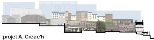
projet A. Créac'h